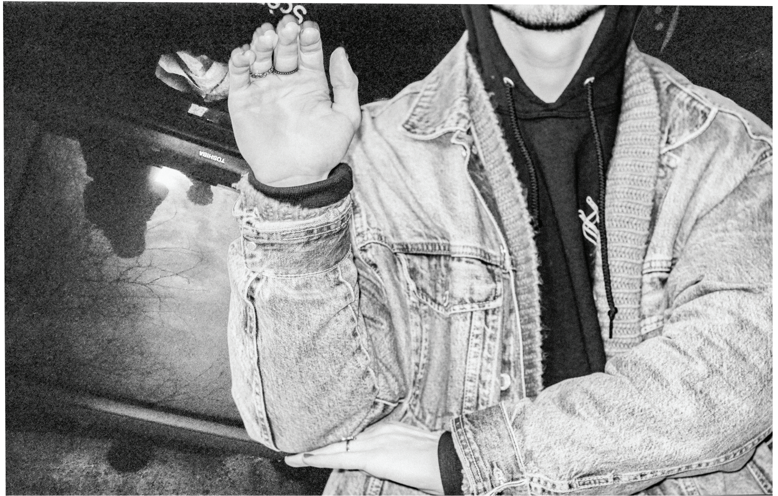
ILLUSTRATION : ÉMILE ARSENAULT-LANIEL, MONTRÉAL CAMPUS

Selon Audition Québec, organisme gouvernemental, la majeure partie des grosses productions américaines s'avère ainsi compatible avec CaptiView. À l'inverse, pour la plupart des productions québécoises ou francophones, le système est peu accessible. Dans les cas rares où cette technologie est proposée, certain(e)s jugent la machine difficilement accommodable. C'est le cas de