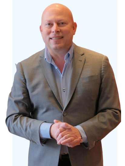
Le recteur Stéphane Pallage

L'article complet est disponible sur le site Web du Montréal Campus.