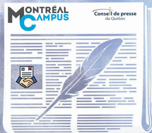
ILLUSTRATION : KILIAN BEAUCHESNE, MONTRÉAL CAMPUS

Un engagement que nous léguons aux prochaines équipes du Montréal Campus avec fierté. Car un média n'est rien sans la confiance de son public. Bonne lecture de cette quatrième et dernière édition papier de l'équipe 2025-2026! ♦